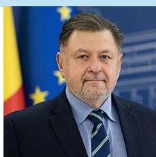
Prof. Univ. Dr. Alexandru Rafila

Président de la Commission de la santé de la Chambre des députés.