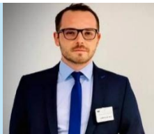
Ministre Dr. Alexandru-Florin Rogobete Ministre de la Santé de Roumanie.